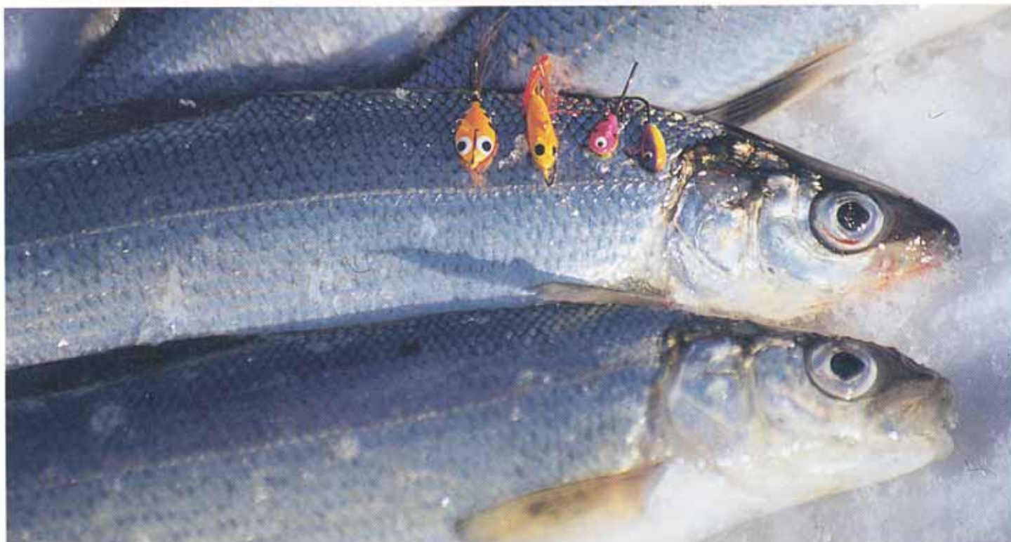
Felchen können den kleinen bunten Hüpferlingen nur selten widerstehen.

scher Guide, zeigt uns die richtige Handhabung der Angelgeräte für das Eisfischen. Rute und Rolle erinnern mich an Playmobil: die Rute ist kaum armlang, der Blank ist aus Kunststoff und die am Griff fixierte Rolle gleicht einer Silchspule. Als Köder bindet Tapani eine Mormuska an. Das ein bunter bohnenförmiger Bleikopf auf einem Haken mit einem farbigen Glitzerschwänzchen. Sie soll je nachdem ein Wasserinsekt oder ein kleines Fischchen imitieren.