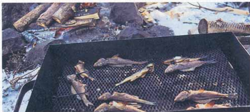
Outdoor-Räuchern: Die frisch geräucherten Fische sind eine Delikatesse.

Immer wieder schweift nun mein Blick über den zugefrorenen See: In Gedanken versunken, genieße ich die weite offene Landschaft. Der Schneeflaum auf Schilf und Birken glitzert im wärmenden Winterlicht. Mit der untergehenden Sonne packen wir unsere Sachen zusammen und freuen uns auf die finnische Sauna in der gemütlichen Blockhütte. Unsere Gastgeber schütten im Schwitzkasten dann noch kräftig Wasser auf die heißen Steine und setzen sich sogleich wieder auf die oberste